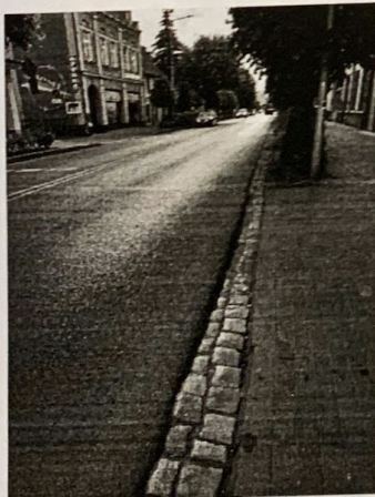
Fragment ulicy Piłsudskiego