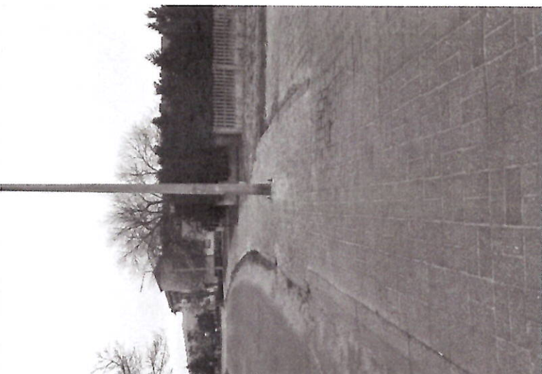
Załącznik nr 1 Ulica Kmicica , oraz lokalizacja ich obecnego umieszczenia w obszarze chodnika.