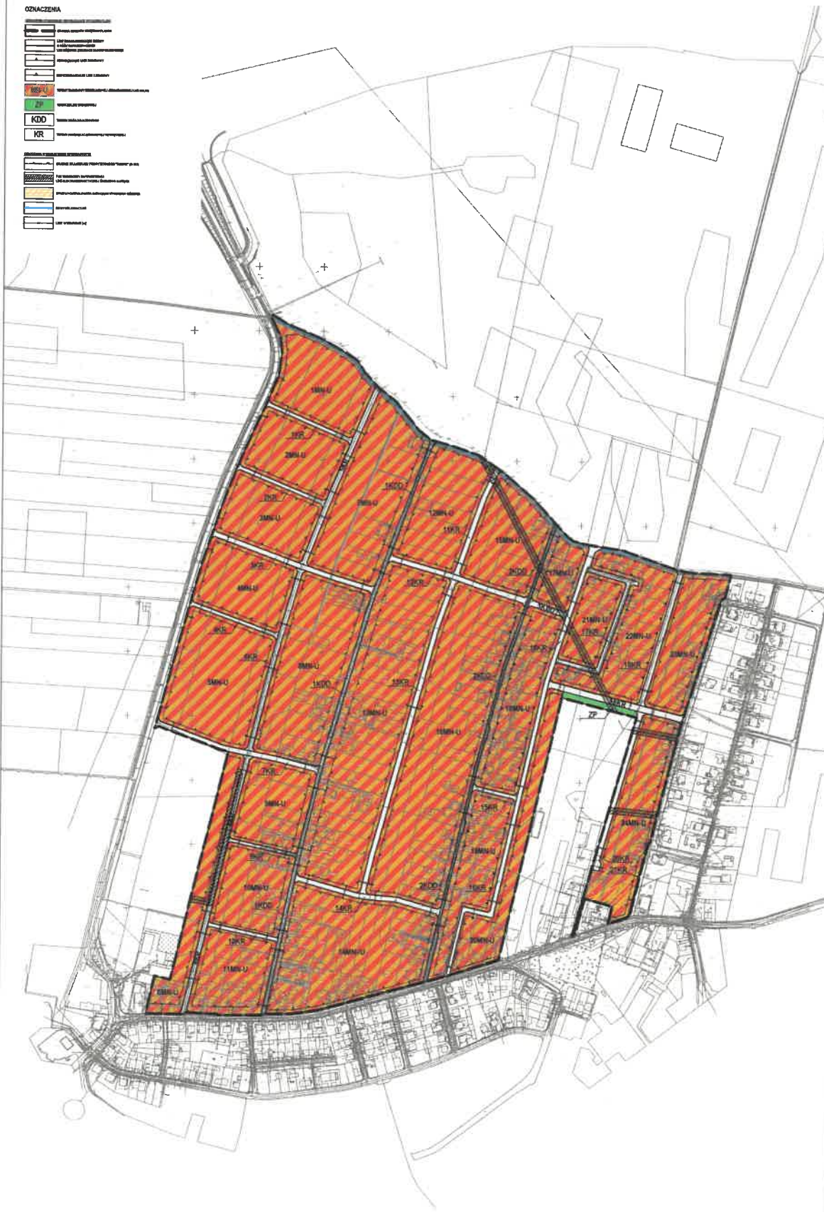
WYRYS ZE STUDIUM UMARUNKOWAŃ I KIERUNKÓW ZAGOSPODAROWANIA PRZESTRZENNEGO GMINY RAWICZ Z OZNACZENIEM GRANIC OBSZARU OBJĘTEGO PLANEM SKALA 1:20 000